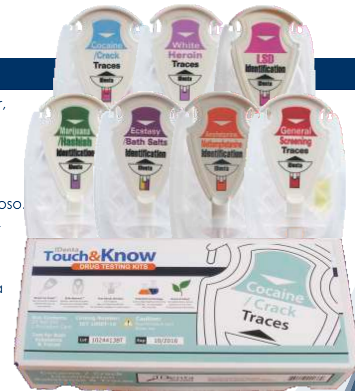
Caja de 10 kits

Cada unidad de prueba consiste en un tomador de muestras, hasta tres ampollas de vidrio rompibles y selladas herméticamente, y una cámara de reacción.